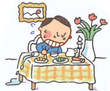
Tại bàn ăn