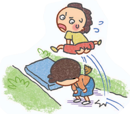
Trong lúc chơi nhảy ngựa