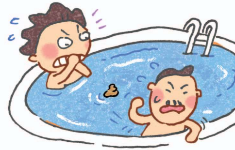
Trong hồ bơi