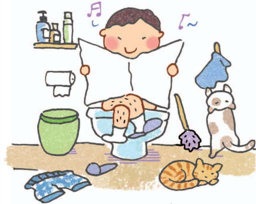
Trong nhà vệ sinh