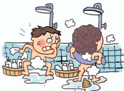
Trong nhà tắm công cộng