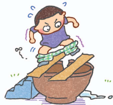
Trong nhà vệ sinh cũ