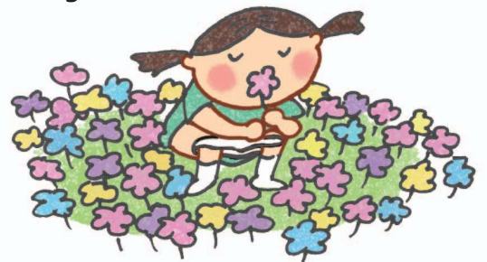
Trong vườn hoa