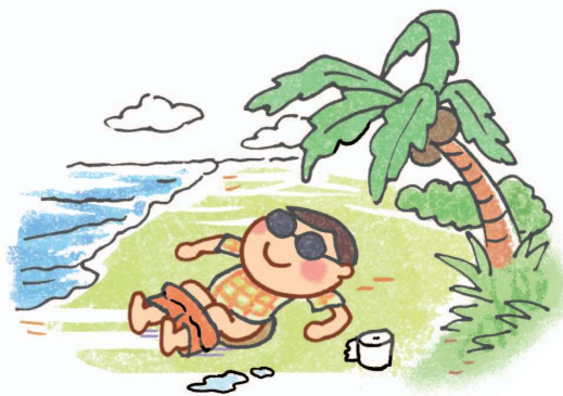
Bên bờ biển