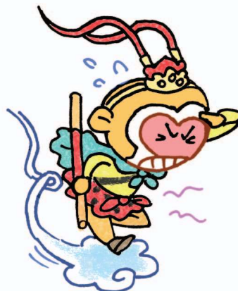
Đi tới nơi ngũ cốc luân hồi (Trung Quốc cổ)