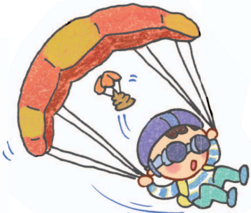
Khi đang nhảy dù