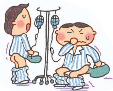
Trong bệnh viện