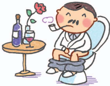
Trong khách sạn sang trọng