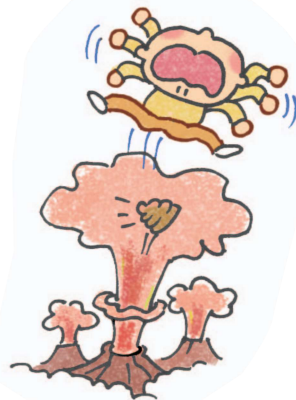
Tại miệng núi lửa