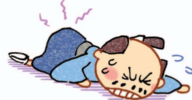
Đi Yukiko (Nhật Bản cổ)