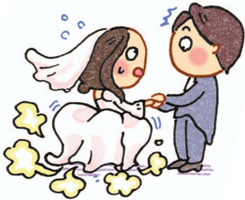
Trong buổi lễ kết hôn