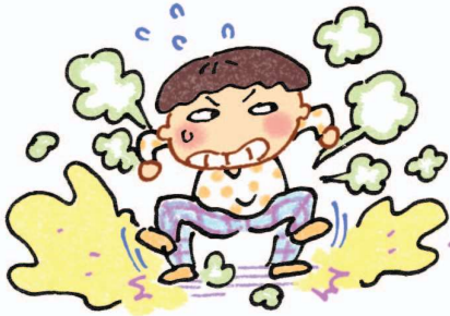
Mượn gió bẻ măng (Giậm mạnh chân, để bụi bay mù mịt)