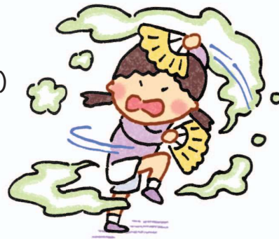
Xua hồ diệt sói (Dùng quạt quạt bay mùi xì hơi)