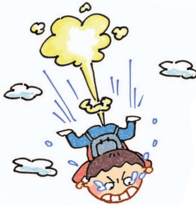
Khi nhảy dù