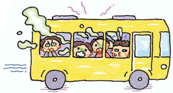
Trên xe buýt