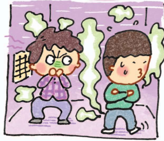
Khi đi thang máy