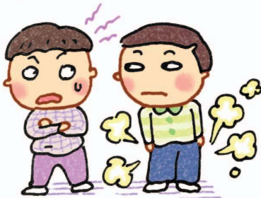
Ngây ngô như ngỗng (Nhìn chăm chăm vào người khác, giả vờ như không liên quan)