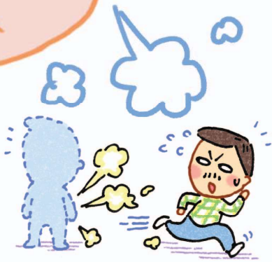
Ve sầu thoát xác (Nhanh chóng rời khỏi chỗ vừa xì hơi)

"Ba mươi sáu mưu kế" xì hơi, xì hơi cũng cần "thủ đoạn".