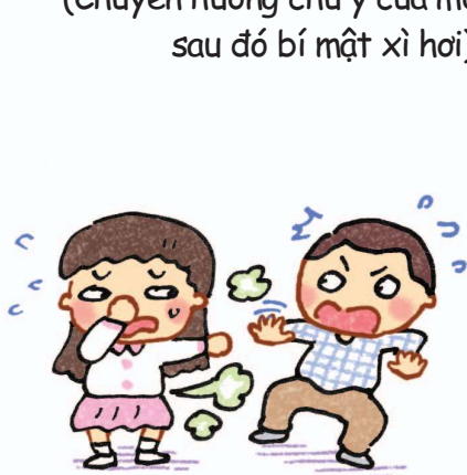
Đổ cho người khác (Nhanh trí đổ cho người khác xì hơi chứ không phải mình)