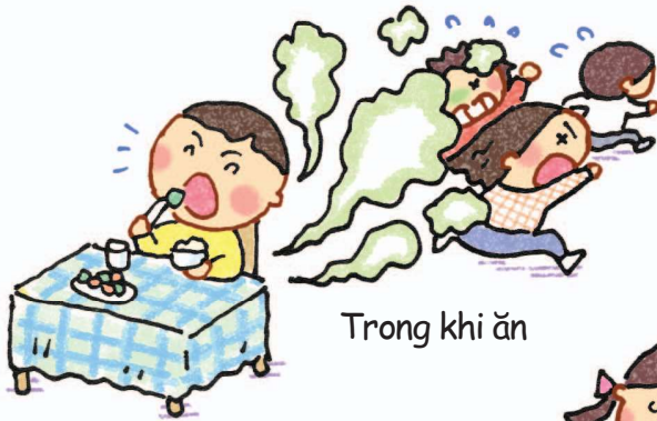
Trong khi ăn