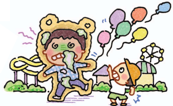
Khi mặc trang phục gấu bông