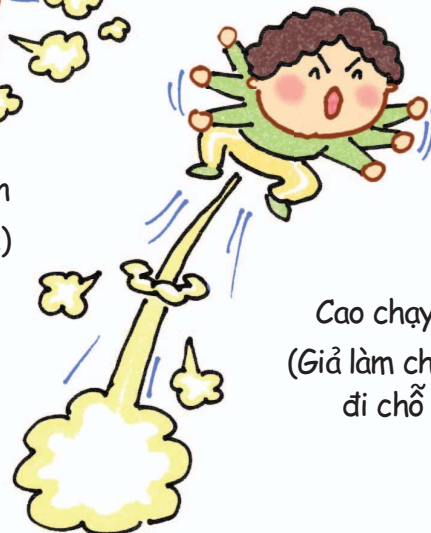
Cao chạy xa bay (Giả làm chim và bay đi chỗ khác)