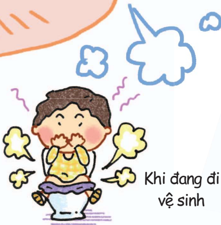
Khi đang đi vệ sinh

Dù bạn đang ở đâu, một khi đã muốn xì hơi thì đều không thể kìm lại được, và ai cũng muốn được xì hơi một cách thoải mái nhất.