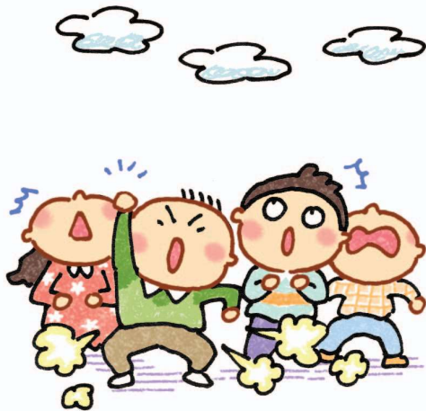
Dương đông kích tây (Chuyển hướng chú ý của mọi người, sau đó bí mật xì hơi)