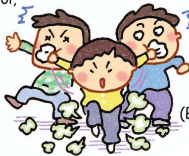
Che mắt che tai (Bịt mũi của những người xung quanh)