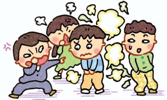
Mặt chết thay đào (Xì hơi ngay sau khi người khác vừa xì hơi)