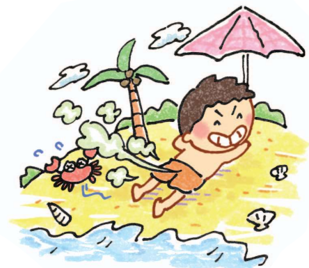
Trong lúc tắm nắng