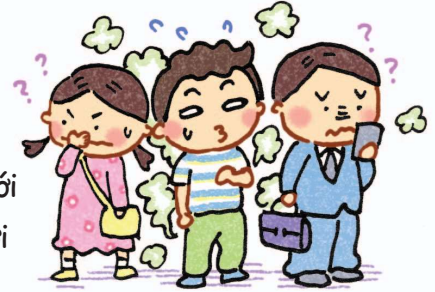
Lừa trên dối dưới (Cẩn thận xì hơi trong im lặng)