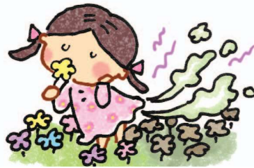
Khi đang ngắm hoa