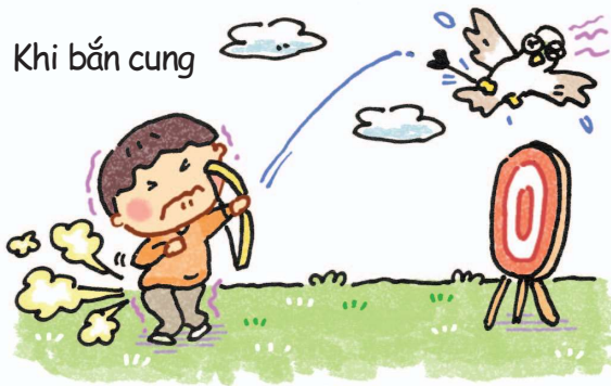
Khi bắn cung