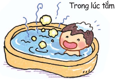
Trong lúc tắm