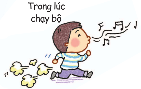
Trong lúc chạy bộ