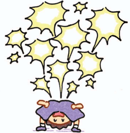
Sấm sét giữa trời quang (Xì hơi thật to và vang như sấm rền)