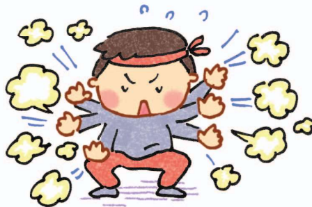
Dồi núi lấp biển (Xì hơi liên tục)