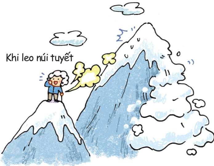
Khi leo núi tuyết